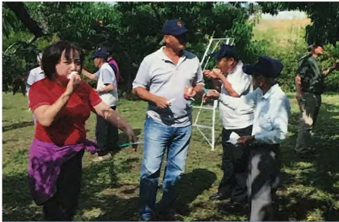
日本生產量第一美味完美熟成的水蜜桃第一為傲的山梨縣，採果樂。體驗生態、產業、文化、觀光。