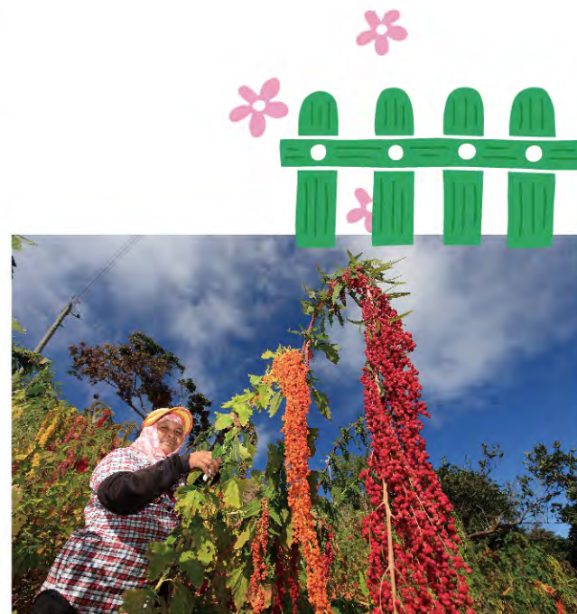
原住民與紅藜

而紅藜的親戚「藜麥」，原生卻是在南美洲，比較常看的是白、黑、紅三種色系，因此市面上常看見的紅色「藜麥」與「台灣紅藜」，因為都是紅色系且名稱相近，常常會消費者誤認為一樣的農作物。