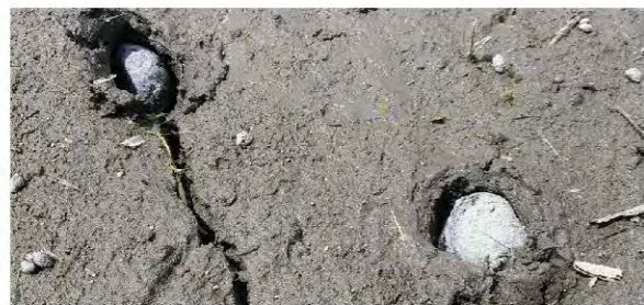
乾旱時福壽螺鑽入土裡防曬休眠。

事實上，不只在台灣，福壽螺對於農作物造成的危害，已被許多國家視為入侵物種造成農業損失，甚至還被國際自然保護聯盟物種存續委員會的入侵物種專家小組列為「世界百大外來入侵種」，幾乎成為世界農夫們的全民公敵。然而，站在收成農作物的觀點，福壽螺是危害；但是站在收成福壽螺的角度，福壽螺卻又變身成為搖錢樹，究竟福壽螺是好還是不好呢？