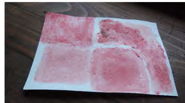
將福壽螺卵塗在卡紙上，一個月還不會掉顏色。