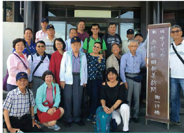
國際交流，增進情誼。