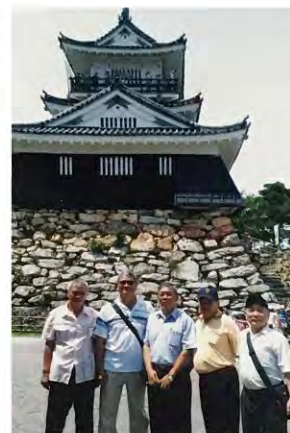
古色古香，雄偉矗立的浜松城