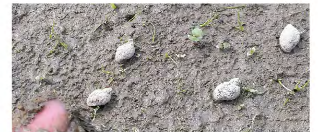
幼小的福壽螺是許多合鴨的零嘴。

而這些多元文化的小巧思，往往只需要我們對於物種特性多加觀察，善用網路找尋創意。相信台灣農業的美好將來，福壽螺將不再只是農民公敵，人與自然萬物的共處，就看我們如何開拓心胸找尋平衡，為農業開創新出路!