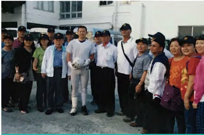
台灣之光 現就讀OISCA高職部台灣學生，也是該校棒球隊投手。