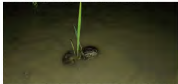
福壽螺偏好軟嫩的植物，爬行經過的作物通通成為盤中餚。