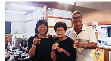
坂中樣精心安排歡迎會