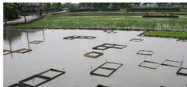
農田裡的科學家，在田裡設置陷阱科學化的研究福壽螺生物習性。

但是與其說是防治技術，不如說是誰對於福壽螺的生物習性有了更透徹的瞭解。在友善小農群聚的宜蘭，就有「農田裡的科學家」發起「福壽螺退散計畫」，利用科學化的研究福壽螺生態習性，發現在香蕉、高麗菜、米糠加鹿仔菜等當地農民常用的誘餌當中，屬於「夜貓子」的福壽螺偏好米糠。若以米糠作為誘餌設置陷阱，每分地放25的裝置誘捕一週，移除率可達50%。一隻福壽螺一天的食量大約可以吃掉半碗飯的米粒，因此每年造成上億元的農業損失。對於水稻而言，插秧前期的一個月內更是與福壽螺對抗的關鍵時機，有效地控制水位考驗著農夫們「巡田水」的功力。