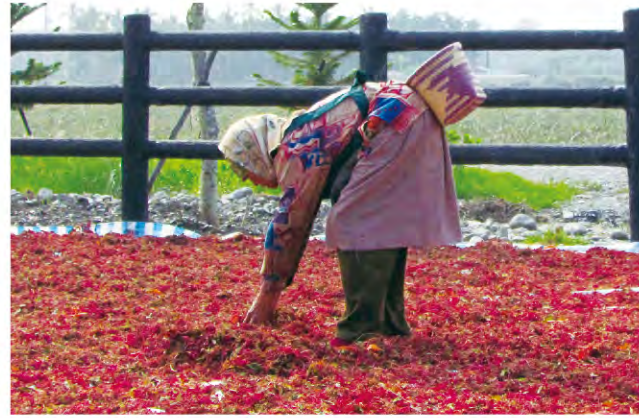
原住民與紅藜