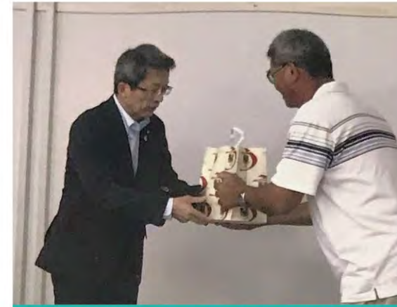
贈送禮物及會後團體照(森町役場)前合影