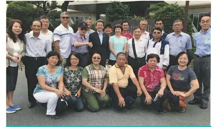
太田町長告訴台糖公司高雄廠(台灣製糖株式會社)第一任社長鈴木藤三郎，他的家鄉是森町，現居民以他為榮。前幾年町長也組團到台糖高雄廠參訪。