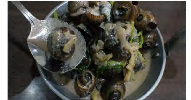
福壽螺加入蝦醬和椰漿就成為菲律賓著名鄉土菜。

相較於日本，比台灣更炎熱的菲律賓也甚少聽到福壽螺對於水田造成的危害。雖然福壽螺生物特性依舊偏好軟嫩植物，但是在民以食為天的前提之下，福壽螺除了成為農村居民重要的蛋白質來源，更是著名的菲律賓鄉村料理。由於人們撿拾福壽螺食用的速度，比福壽螺啃食農作物的速度還快。福壽螺不但未造成農作損失，反而成為佳餚，甚至也增加了村民們的經濟收入。