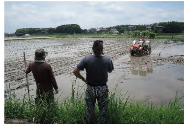
插秧時節適當將螺留在水田中能夠抑制雜草生長。

而我們印象中粉紅成串的福壽螺卵，甚至還成為崇尚自然藝術家的作畫顏料。福壽螺卵的粉紅色素，塗抹在卡紙上不但沒有腥臭味，一個月還不會掉顏色。